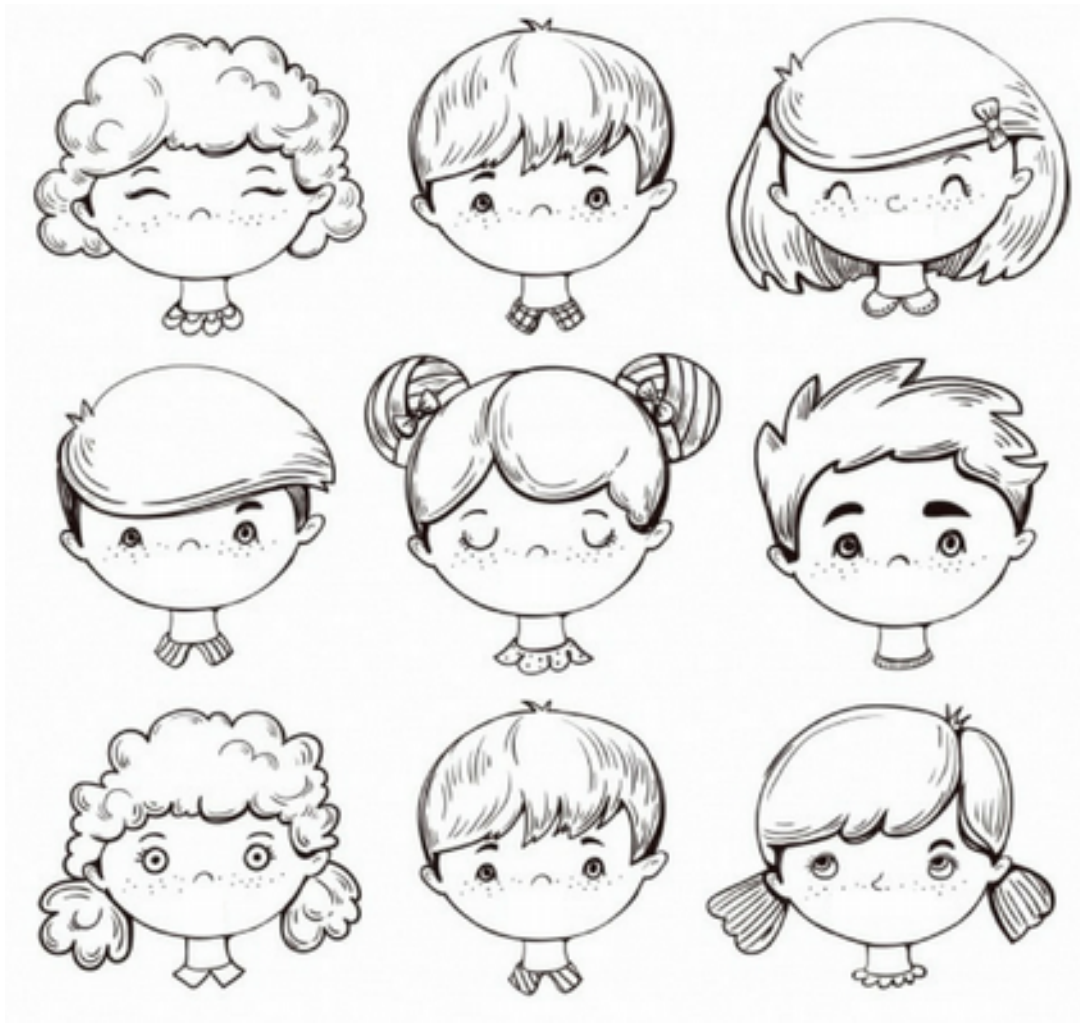
Imagen de 4 a 6 años:

Forma de siluetas de la actividad de 7 a 9: