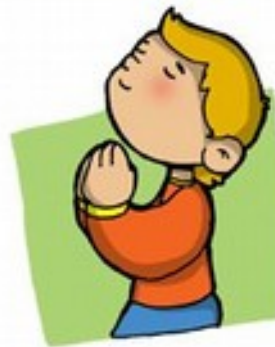
para mí te quiero