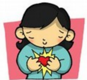
para mí serás.