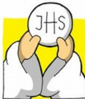
que en la Hostia estás